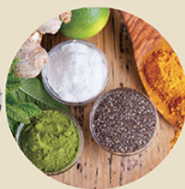
アレンジは独創的に