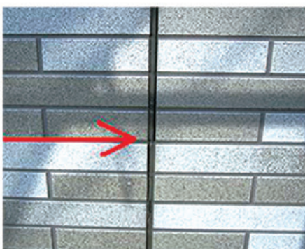
(シーリングをチェック)

この材料自体は30年といわずまだまだ長い耐用年数があるのですが、このサイディングに使われている「シーリング」という防水材の耐用年数が7年～10年と短いのです。